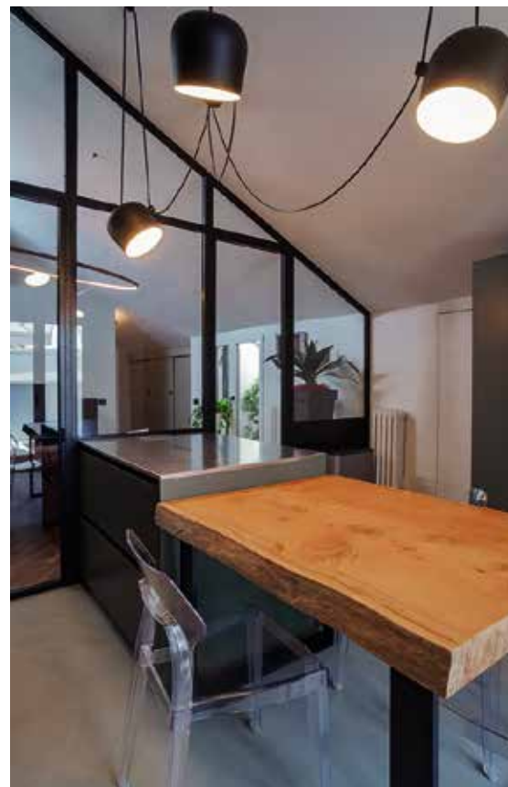
Cucina realizzata da Arredamenti A di Aguzzoli

Per accentuare la presenza della falda di copertura e per massimizzare la luce naturale, si è deciso di eliminare le tramezzature esistenti della zona giorno e di separare la cucina tramite una vetrata a tutta altezza